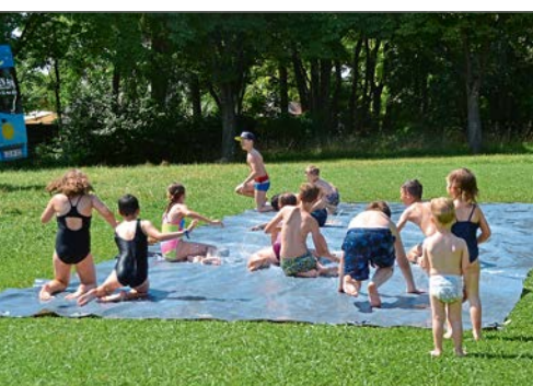
Die Kinder hatten in der Spielbuswoche wieder jede Menge Spaß. (get)