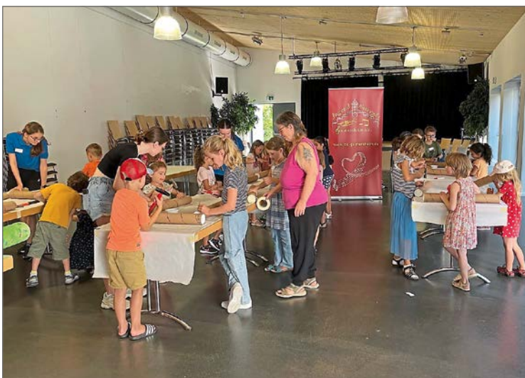
Die Kinder hatten jede Menge Spaß beim Instrumente basteln. (Jugendblaskapelle Gaimersheim)