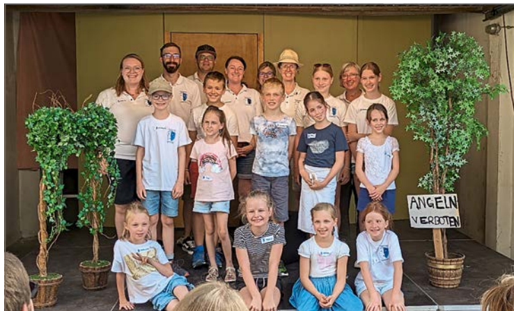
Die Kinder hatten beim Ferienprogramm des Theatervereins jede Menge Spaß, sodass sich einige Kinder entschlossen haben in der nächsten Kindergruppenstunde vorbeizuschauen. (Mike Straube)

Zum Abschluss genossen alle zusammen noch eine Pizza, bevor der Theaterworkshop zu Ende ging und alle Kinder mit einem strahlenden Gesicht nach Hause gingen.