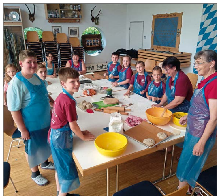
Impressionen vom Zeltlager.