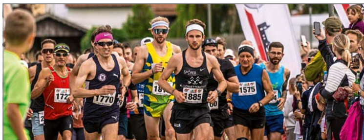
Teilnehmerrekord beim diesjährigen Retzbachlauf.