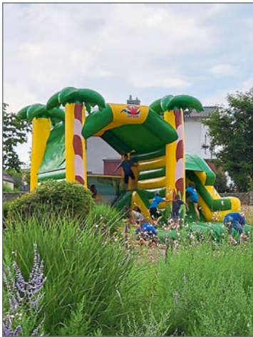
Auf der Hüpfburg oder beim Blasrohrschießen hatten die Kinder jede Menge Spaß. (get)