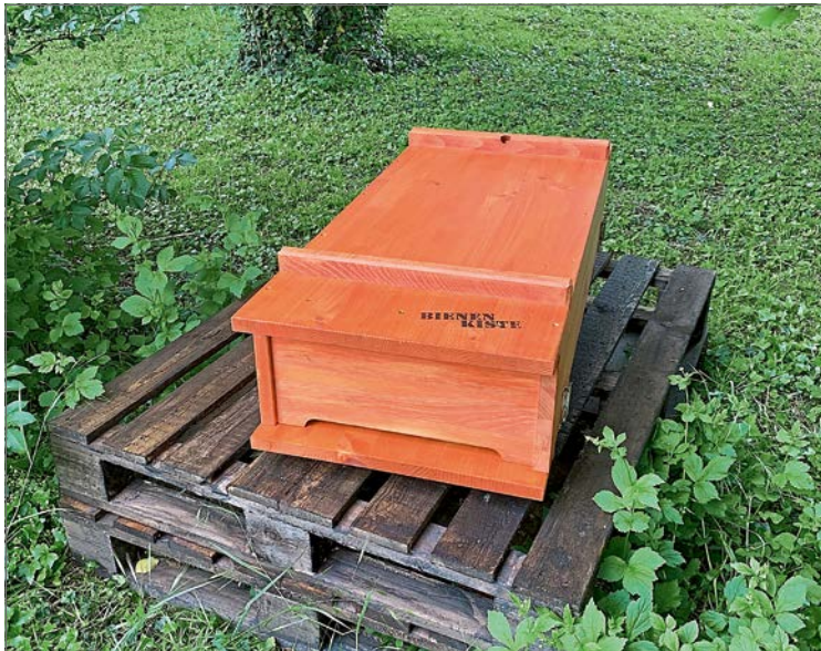
Der Obst- und Gartenbauverein Gaimersheim gewann eine Bienenkiste mit Zubehör. (get)

quasi vor die Kiste gekippt, so dass die Bienen alle gleich in ihr neues Zuhause laufen konnten. Die erste Zeit sind die Bienen damit beschäftigt ihr neues zu Hause mit Waben auszubauen. In dieser Zeit dürfen die Bienen nicht gestört werden. Sobald es möglich ist, wird der Verein im Rahmen den Kindergarteln sich den Naturwabenbau mit den Gartlkindern anschauen. (get)