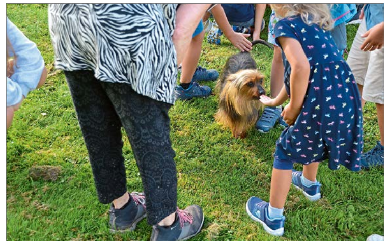
Zum Schluss durften die Kinder die Hunde streicheln und füttern. (get)