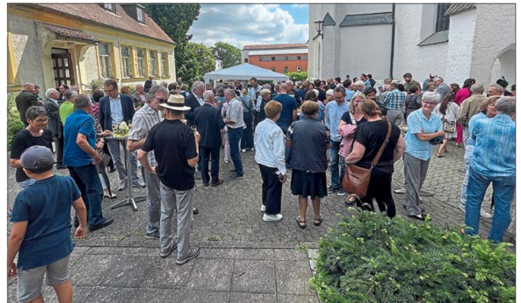
Nach dem Gottesdienst wurde vom Pfarrgemeinderat ein Kirchencafé organisiert.