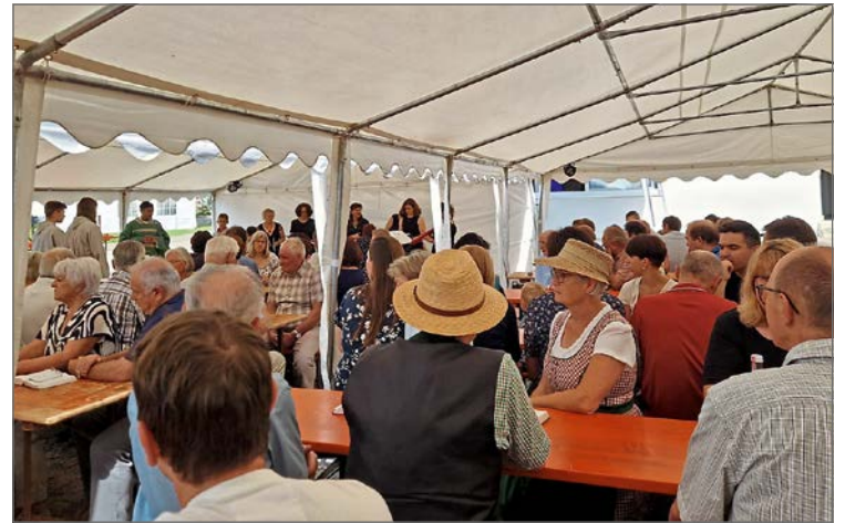
Am Sonntagfrüh wurde der Gottesdienst am Dorfplatz gefeiert. (get)