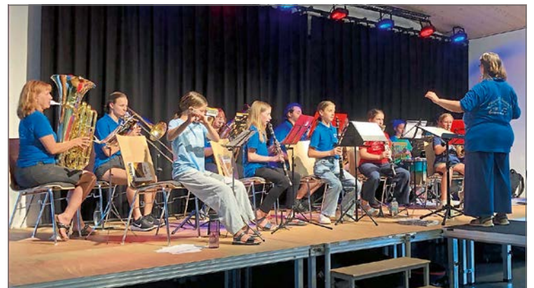
Die Jugendblaskapelle lud zum Sommerkonzert ins Backhaus Gaimersheim.

Wer innerhalb der Zuhörerschaft neugierig geworden war, durfte nach Abschluss des rundum gelungenen Konzertes noch die einzelnen Instrumente mit Tipps erfahrener Musikanten ausprobieren und den bereitgestellten Instrumenten so manchen unerwarteten Ton entlocken. Noch viel mehr zu hören wird es im großen Konzert der Jugendblaskapelle geben, denn am 23. November 2024 lädt das Markt-Orchester Gaimersheim wieder um 18 Uhr zum großen Jahreskonzert in die Aula der Mittelschule Gaimersheim, mit dem Thema „Pictures“ ein. Die Musikanten freuen sich schon sehr darauf.