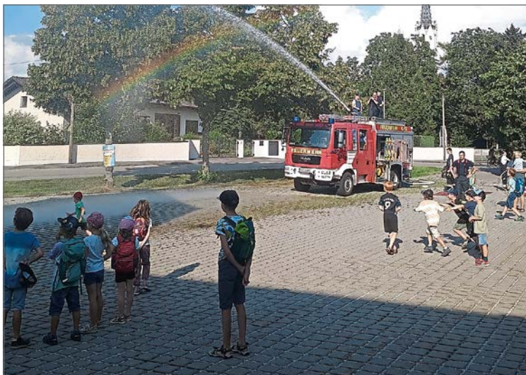
Die Kinder konnten bei der Feuerwehr einen schönen Nachmittag verbringen.

Zum Schluss durften sich die Kinder über eine Abkühlung freuen in Form von einer Dusche mit dem Wasserwerfer und einem Eis. Nach diesen Eindrücken überlegt der ein oder andere selbst einmal zur Feuerwehr zu gehen. (get)