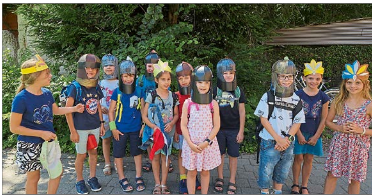
Stolz trugen die Kinder ihre selbstgebastelten Ritterhelme oder Prinzessinnendiademe nach Hause. (get)

Es gab viel zu sehen und entdecken und es durfte auch mit den Sachen Kasperltheater, Karussell, Mensch ärgere dich nicht oder Modelleisenbahn gespielt werden, um hier nur einige Beispiele zu nennen. Bevor es mit viel gesammelten Eindrücken wieder in Richtung Heimat ging, konnten sich die Kinder im Kreativraum noch einmal richtig austoben. Stolz trugen sie ihre selbstgebastelten Ritterhelme oder Prinzessinnendiademe nach Hause. (get)