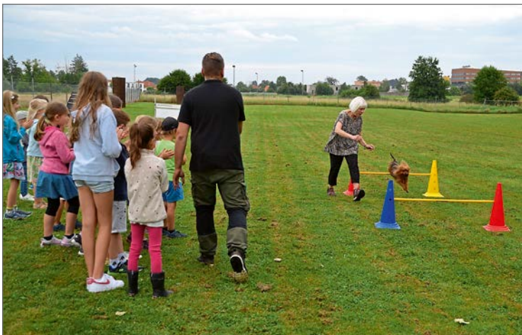
Zuerst durften die Hunde den Hindernisparcours durchlaufen, dann die Kinder. (get)