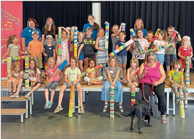
Im Nu war das diesjährige Ferienprogramm der Jugendblaskapelle ausgebucht.

len. Während die fertigen Instrumente trockneten, amüsierten sich die Kinder bei gemeinsamen Gruppenspielen. Stolz haben die Kinder ihre Regenmacher mit nach Hause genommen. Vielleicht konnte bei manchen das Interesse zur Musik geweckt werden und sie melden sich zur neuen Bläserklasse im Oktober 2024 an. Infos dazu können auf der Internetseite www.jbk-gaimersheim.de entnommen werden. (get)