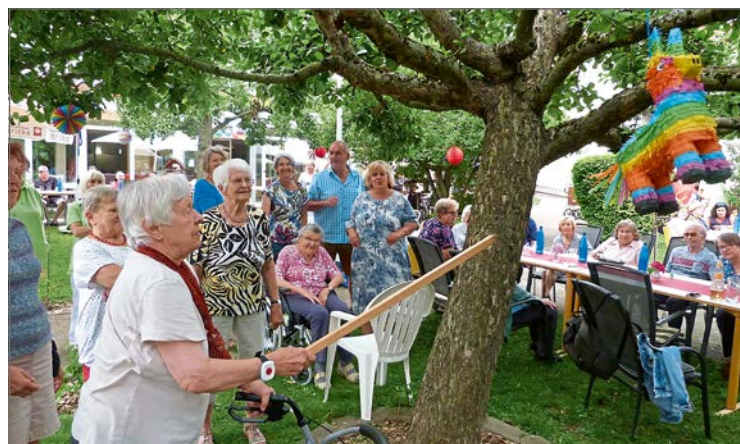
Das Pflegepersonal bastelte für die Senioren eine Pinata.