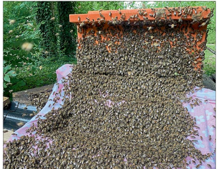
Der Verein suchte einen Naturschwarm um die Kiste zu besiedeln, dabei wird der Schwarm vor die Kiste gekippt um den Bienen ihr neues Zuhause zu zeigen. (get)