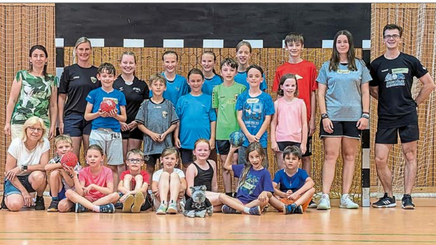
Die Kinder konnten beim Ferienprogramm der Gaimersheimer Jungwölfe in den Handballsport hineinschnuppern.