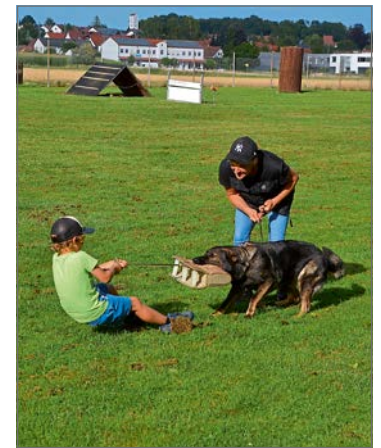
Wie stark ein Hund ist, konnte ebenfalls getestet werden. (get)