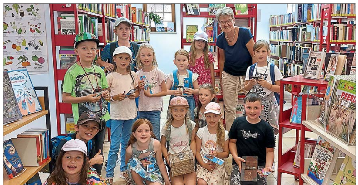
(get) Die Kinder folgten den Hinweisen um zum Schluss das verschwundene Buch zu finden.

Um 14.30 Uhr fiel der Startschuss in der Bücherei Gaimersheim für die Suche nach dem verschwundenen Buch. Nach kurzer Einweisung durch die Betreuer in die GPS-Geräte ging es für die 14 Kinder unter Eingabe der Koordinaten einmal quer durch Gaimersheim um die Rätsel an den verschiedenen Stationen zu lösen. Der Weg führte die Kinder, die mit voller Begeisterung dabei waren, zum Schluss wieder in die Bücherei und mithilfe des gelösten Rätsels des verschwundenen Buches konnte die Schatzkiste geöffnet und natürlich gleich geplündert werden.